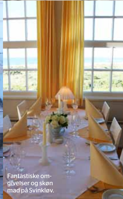
Fantastiske omgivelser og skøn mad på Svinkløv.