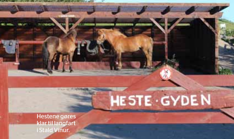
Hestene gøres klar til langfart i Stald Vinur.