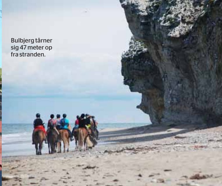
Bulbjerg tårner sig 47 meter op sig 47 meter op fra stranden.