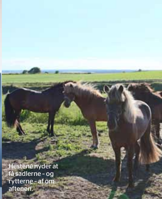
Hestene nyder at få sadlerne - og rytterne - af om aftenen.