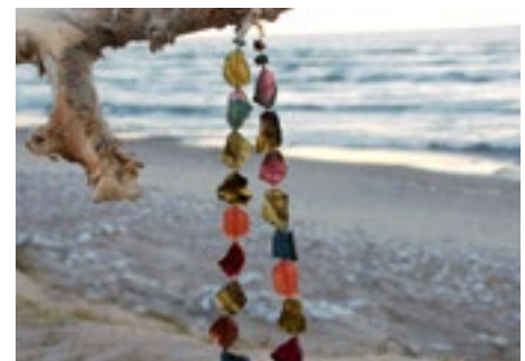
ByLindquist - 20 % Rabatt