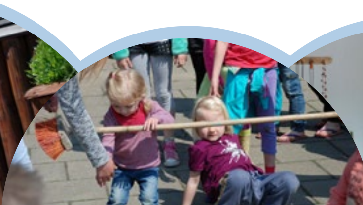
Gemütlichkeit für die ganze Familie