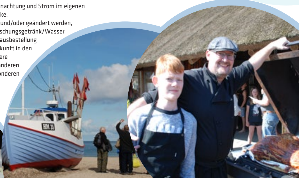
Erwachsenentreffen Nr. 1