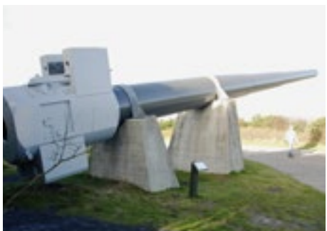
Bunkermuseum Hanstholm - bis zu 33 % Rabatt

Hinweis: Wenn Sie die VIC-Karte kaufen, müssen Sie sich selbst über die Öffnungszeiten der verschiedenen Orte informieren und daran denken, die Karte mitzubringen, um den Rabatt zu erhalten.