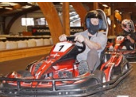
Thy Gokart - 10 % Rabatt