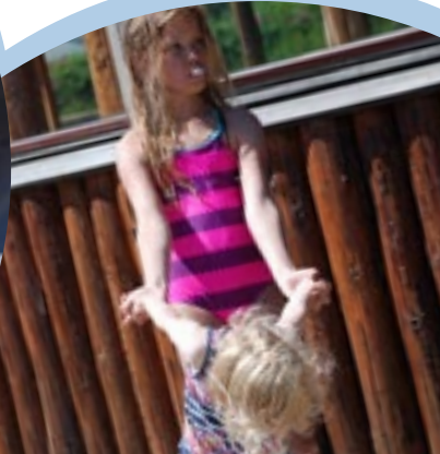
Sonne und Sommer